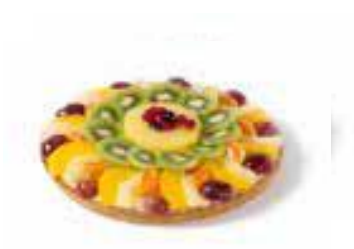
Vruchtenvlaai voor 10 personen € 22,16