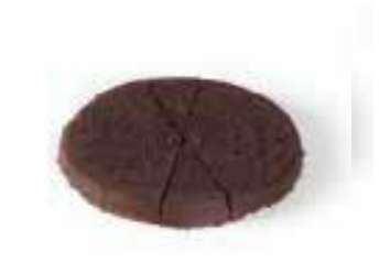
Chocolade hazelnoottaart voor 12 personen € 32,40