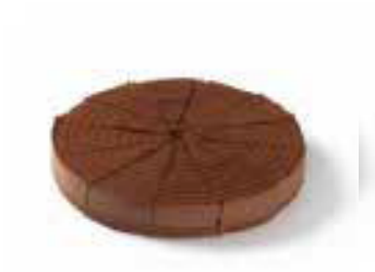
Chocolade truffeltaart voor 12 personen € 30,69