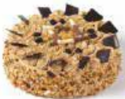
Mokkataart voor 12 personen € 33,42