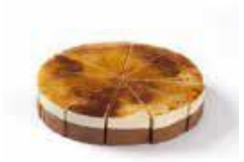
Caramel balsamicotaart voor 12 personen € 32,40