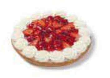
Aardbeienvlaai voor 10 personen € 19,60