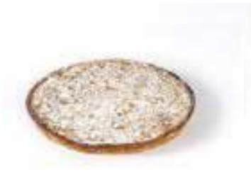
Appelkruimelvlaai voor 10 personen € 34,11