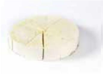
Lemon cheesecake voor 12 personen € 27,29