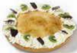
Appel citroenvlaai voor 10 personen € 26,91