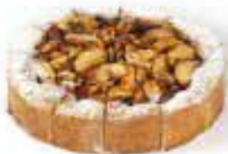
Oma's appeltaart voor 12 personen € 27,29