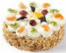
Slagroomtaart voor 12 personen € 27,29