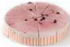
Frambozen cassistaart voor 12 personen € 27,29