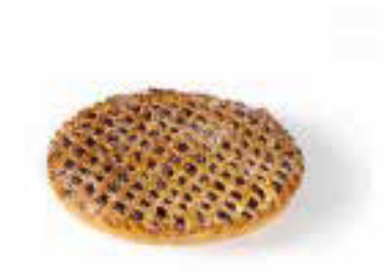
Kersenvlaai voor 10 personen € 17,05