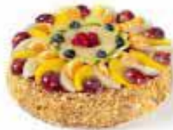
Vruchtentaart voor 12 personen € 28,99