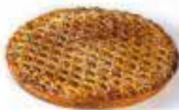
Abrikozenvlaai voor 10 personen € 17,05