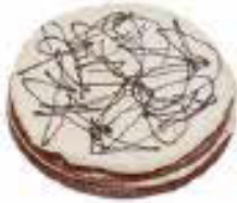
Red velvetaart voor 12 personen € 32,40